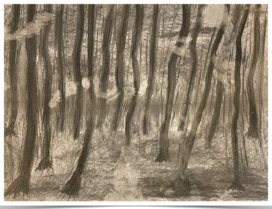
'Witte wieven' door groep 7