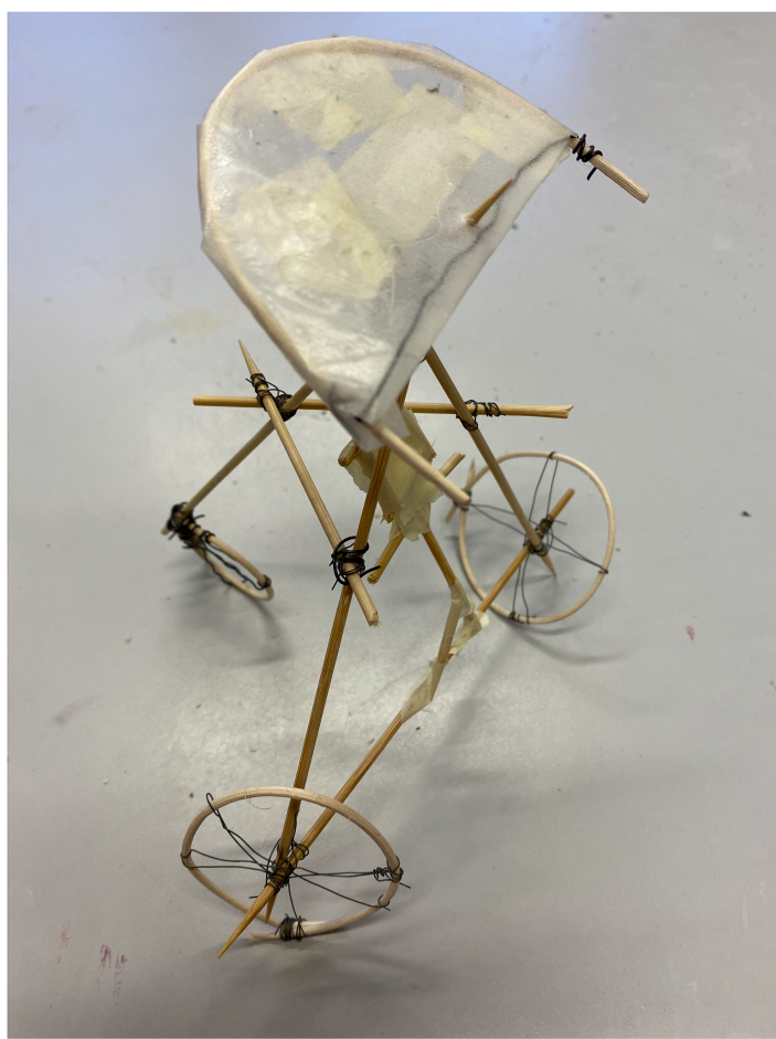
'Vliegfietsen' door groep 8